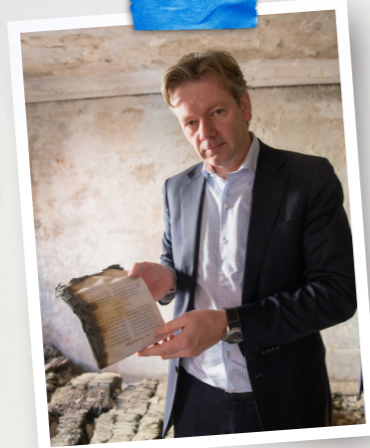
In een verbrande Koptische kerk in Cairo, Egypte (2014)