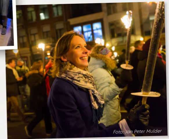
Meelopen met een fakkeltocht in Groningen tegen gasboringen (2017)