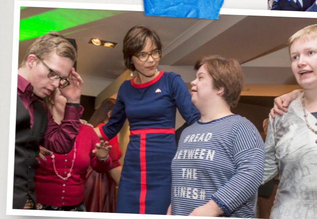
Bij het gezellige 'Down Doet Mee Diner' om Wereld Downsyndroomdag te vieren (2016)

Blijf Carla volgen via: @carladikfaber /carladikfaberCU /carladikfaber