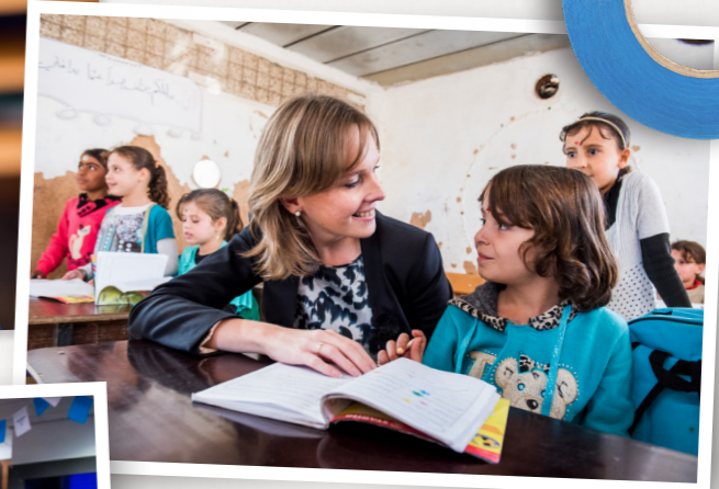
op bezoek in een vluchtelingenkamp in Jordanië (2016)