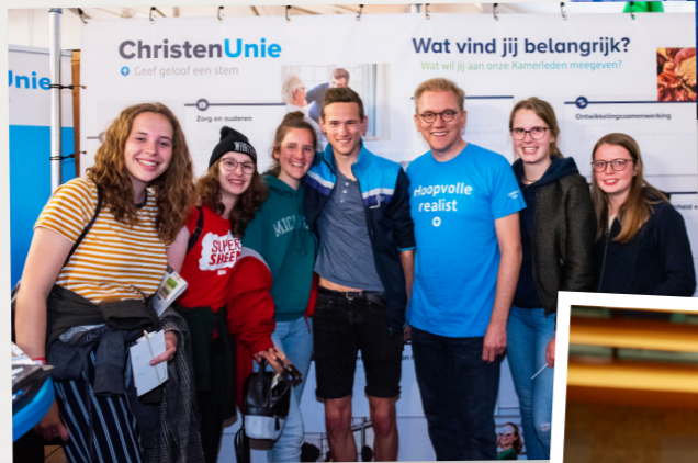
op de foto met bezoekers van de ChristenUnie-stand tijdens opwekking (2019)