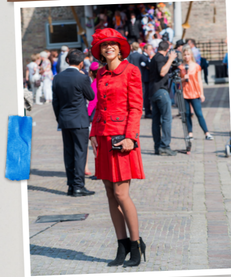
In één van haar unieke Prinsjesdagoutfits, altijd gemaakt van gerecyclede materialen (2014)