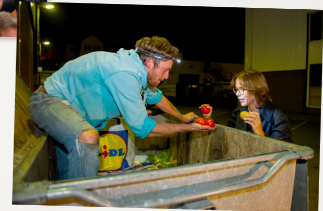
Meelopen bij een avond 'skippen' om te laten zien hoeveel voedsel we in Nederland weggooien (2013)