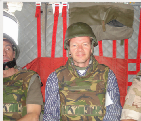
op werkbezoek in Afghanistan bij onze militairen (2008)