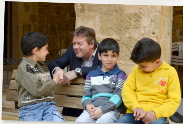
ontmoeting met Syrische vluchtelingen in Turkije (2013)