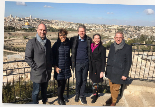
Met de hele Tweede Kamerfractie op rondreis in Israël (begin 2020)