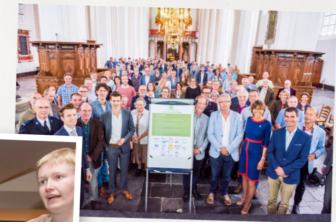
ondertekenen van de Groene Belofte samen met vele andere christelijke organisaties (2016)