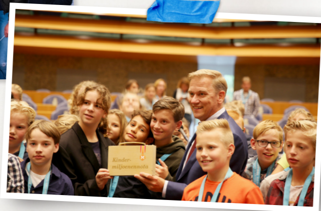
Bij het in ontvangst nemen van de Kindermiljoenennota (2017)