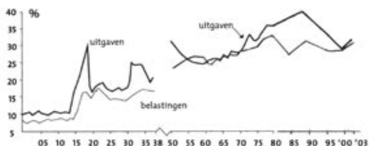
OVERHEIDSUITGAVEN EN BELASTINGEN 1900 -2003