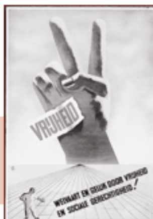
Partij van de Vrijheid 1946