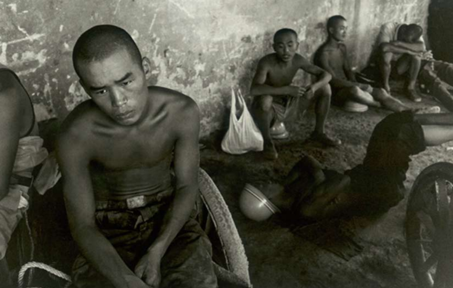
Illegale foto uit heropvoedingskamp.