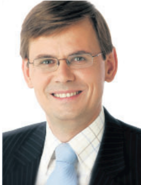
André Rouvoet ChristenUnie