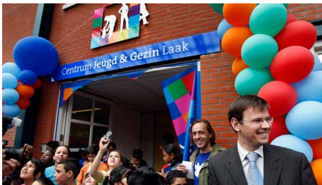
André Rouvoet opende op 25 juni 2008 het Centrum Jeugd en Gezin Laak. Het Centrum in de wijk Laak is het eerste dat geopend is in Den Haag.